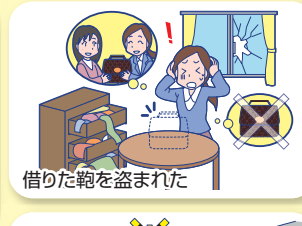
借りた鞆を盗まれた

示談交渉サービス 国内での事故に限り示談交渉は原則として東京海上日動が行います。 *示談交渉サービスのご利用にあたっては、被保険者および相手の方の同意が必要となります。また、訴訟が日本国外の裁判所に提起された場合等を除きます。