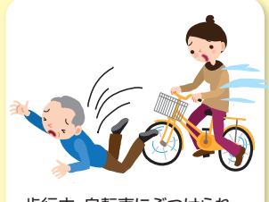
歩行中、自転車にぶつけられ入院・通院した