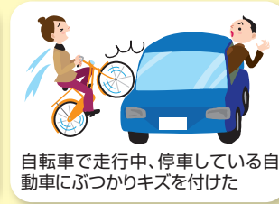
自転車で走行中、停車している自動車にぶつかりキズを付けた