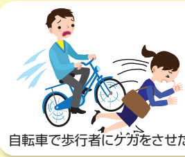
自転車で歩行者にケガをさせた

日本国内外を問わず自転車事故はもちろん、日常生活中(業務中を含みません)の事故で他人を怪我させたり他人の物を壊したりしたことにより法律上の損害賠償責任を負担されたとき等。