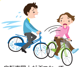
自転車同士がぶつかって入院・通院した

日本国内において自転車に乗っている間の事故。歩いているときに、自転車にぶつけられた事故。