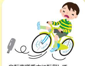
自転車搭乗中に転倒して入院・通院した