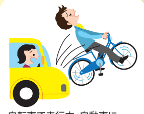
自転車で走行中、自動車にはねられ、後遺障害が生じた