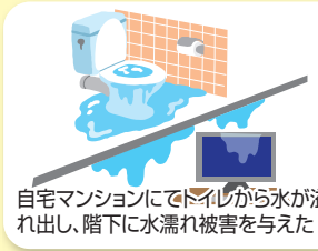
自宅マンションにてトイレから水が溢れ出し、階下に水濡れ被害を与えた